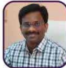
I Madhusudhan Rao IRS (IT)