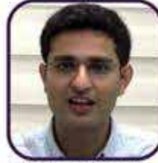
K Vishal Dinanath IAS