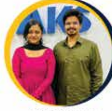
Puthi Bhavana Deputy Collector