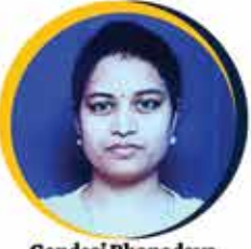
Gondesi Bhanodaya DSP