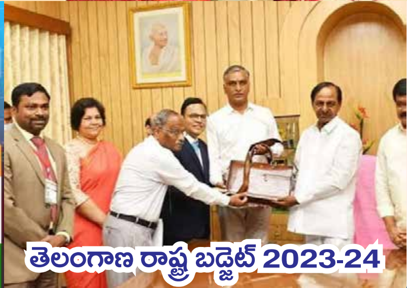
తెలంగాణ రాష్ట్ర బడ్జెట్ 2023-24