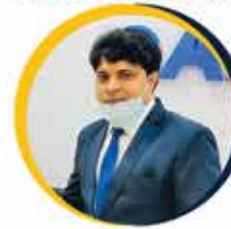
Thirupathirao Ganta Assistant Commissioner of State Tax