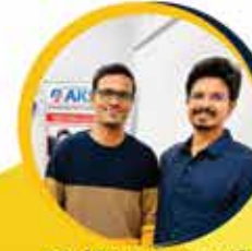
P Sai Eswar Yaswanth DSP