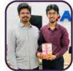
Syed Mustafa Hashmi IPS