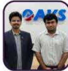
Soumith Raju IFS