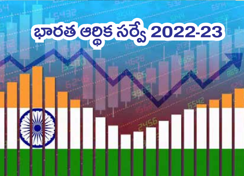
భారత ఆర్థిక సర్వే 2022-23