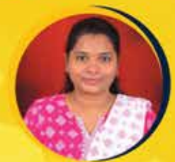
Manisha Regional Transport Officers