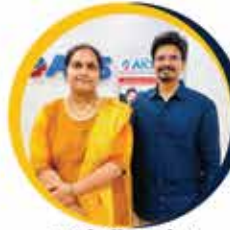
P.Sindhu Priya DSP