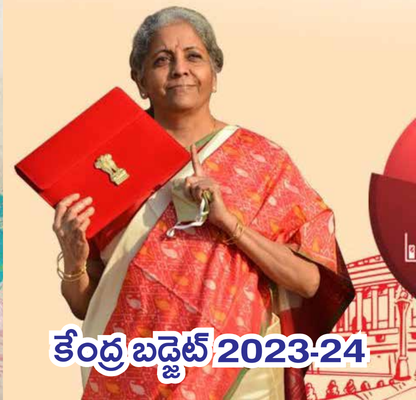
కేంద్ర బడ్జెట్ 2023-24